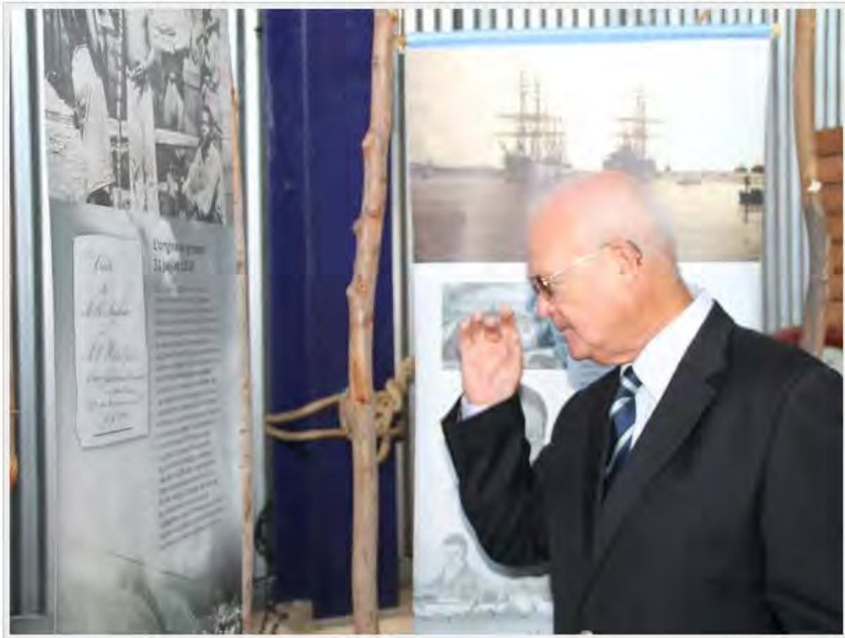
Exposition "Passer pour l'avenir"

Une vingtaine de photos bandeaux, des pans d'histoire, un film et un e-book sont à voir à l'Aventure de Sucre du 2 octobre 2013 jusqu'au 31 décembre 2013.